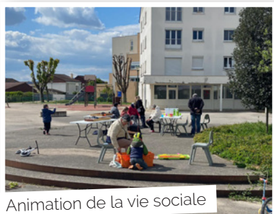
Animation de la vie sociale