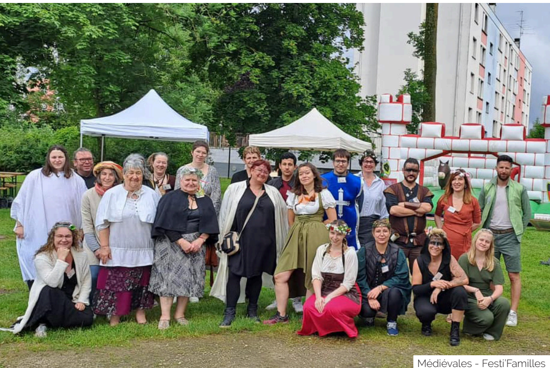
Médiévales - FestiFamilles