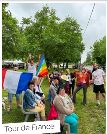
Tour de France