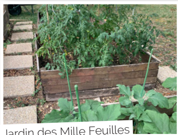
Jardin des Mille Feuilles