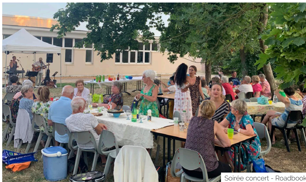
Soirée concert - Roadbook