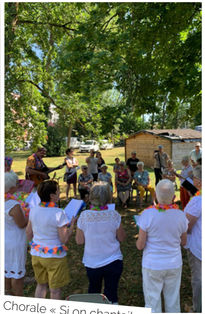
Chorale « Si on chantait »