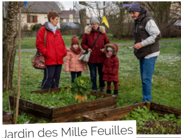
Jardin des Mille Feuilles